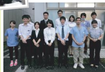
卒業生が働く技工所を訪問。先輩たちや社長さんと一緒に記念撮影。