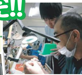
訪問先の先生の説明を聞く姿は超真剣モード!